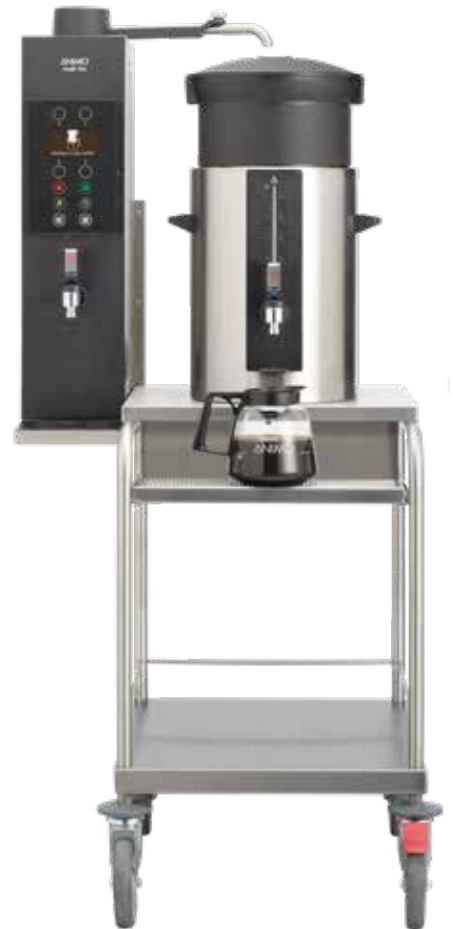
+ Modell S (Modell C ist für 2 Behälter geeignet)