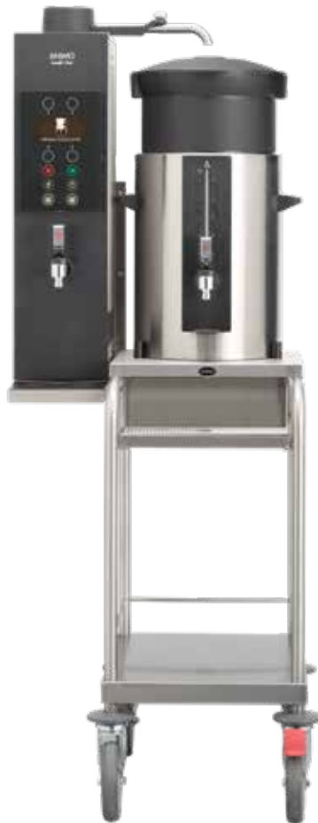
+ Modell J